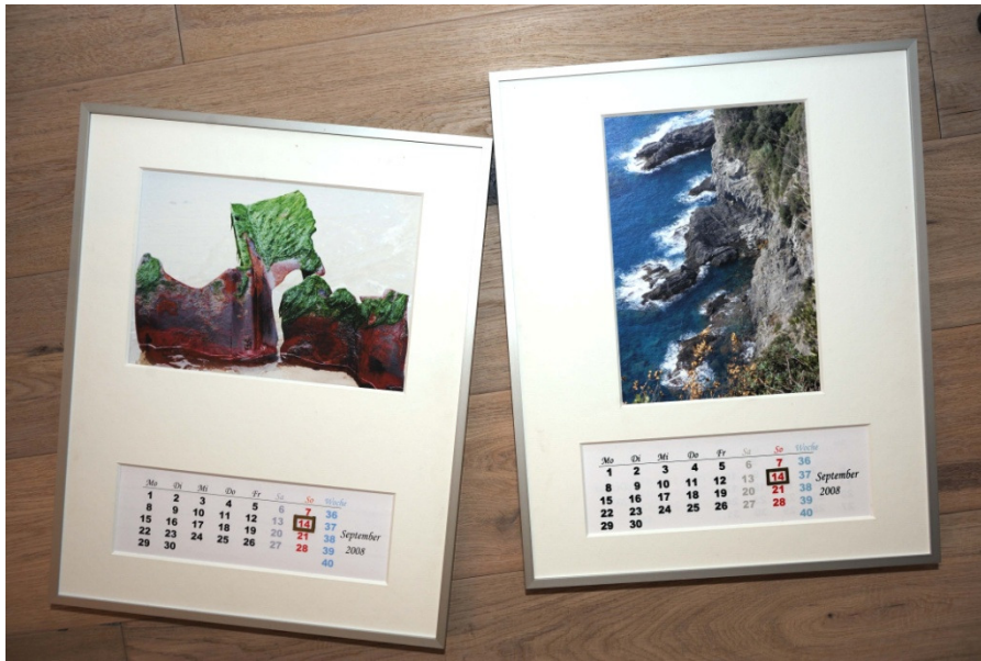
Der edle art&day Kalender mit den magnetischen Messingtageszeigern in Querformat und zusätzlich als Option als Hochformat